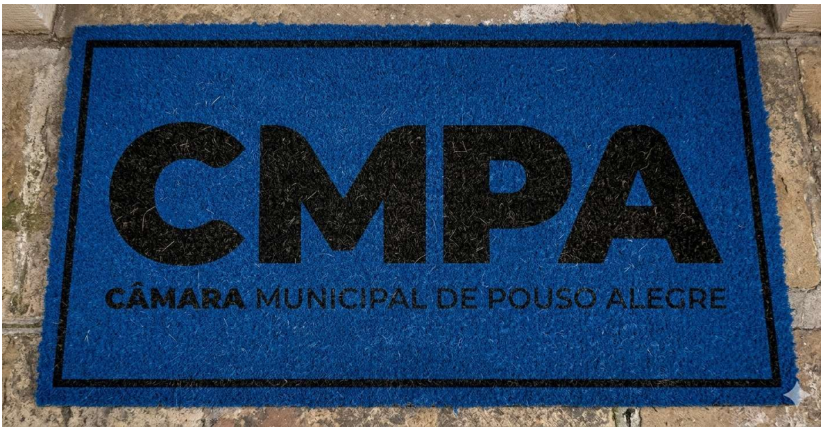
Modelo sugerido em arte criada pela ASCOM da Câmara Municipal de Pouso Alegre.